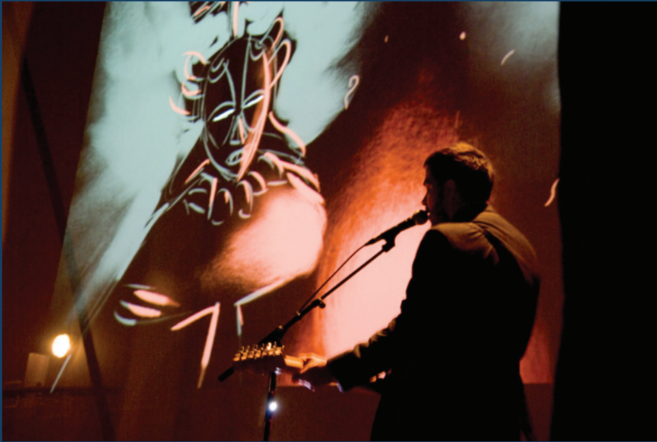
Festival International de la Bande Dessinée, 2010