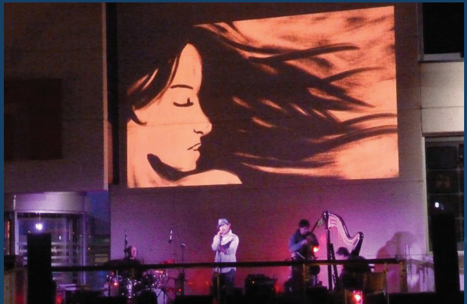
Artrium de Vitoria (Espagne), 2011