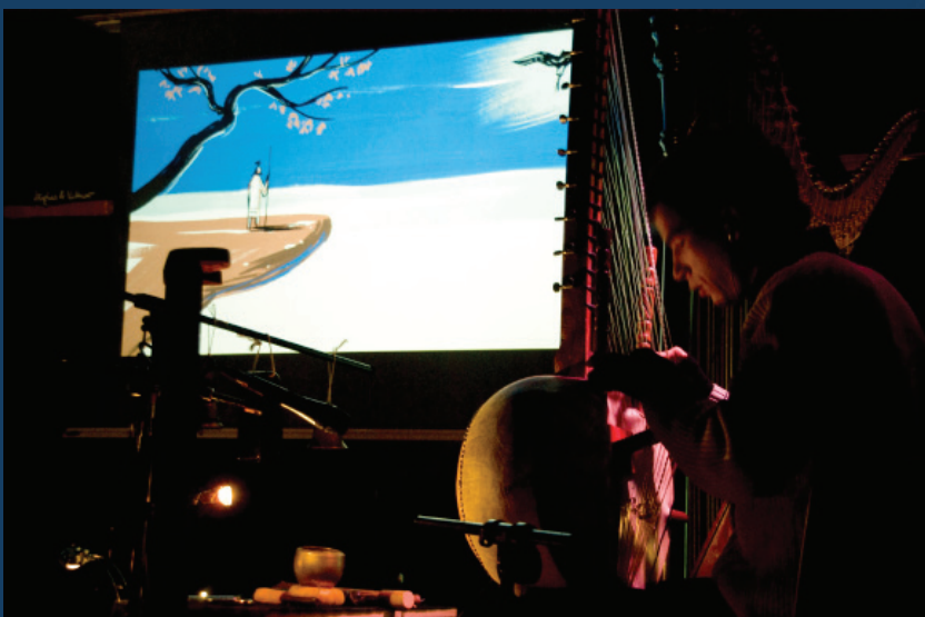
Péniche La Sorellina, Bordeaux, février 2010